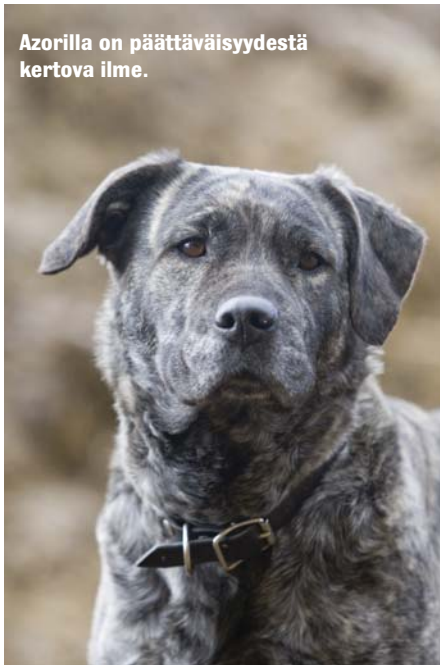
Azorilla on päättäväisyydestä kertova ilme.

– Poikunut lehmä ei päästä ketään lähelle, mutta yllättävän liki omat koirat pääsevät. Sekin osoittaa, että koirien ja nautojen välillä on luottamus. Sekin on nähty, miten nautalauma ajaa vieraan koiran tiehensä. Omaan paimeneen ne suhtautuvat eri tavoin. Naudoilla ja koirilla on myös omaa leikkiä ja toisinaan koirat nuolevat lehmiä turvasta.