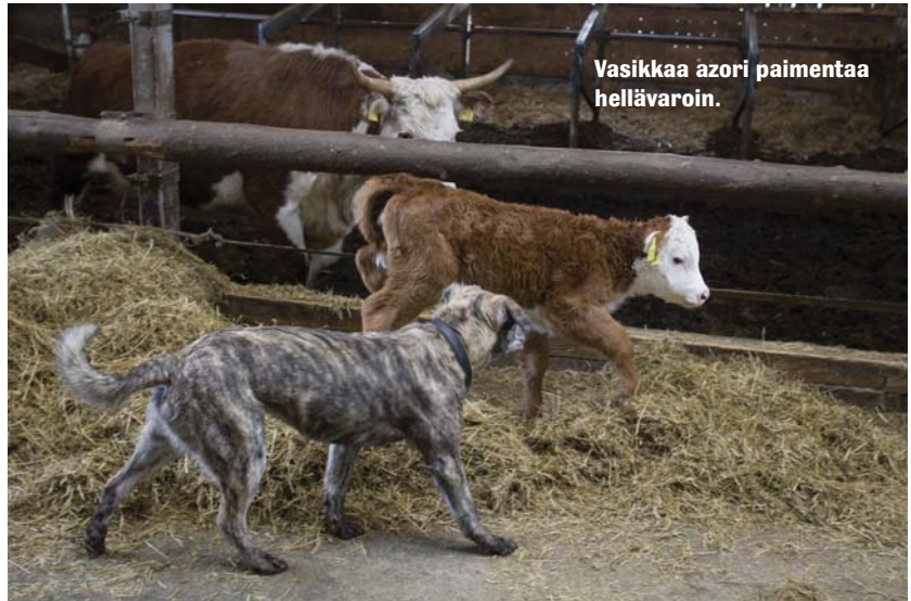
Vasikkaa azori paimentaa hellävaroin.

Azoreilla laidunalueet ovat laajoja. Karja on hajallaan ja kaukana tiloilta. Koira joutuu Azoreilla toimimaan itsenäisesti. Tositööhön ei riitä se, että koira toimii >