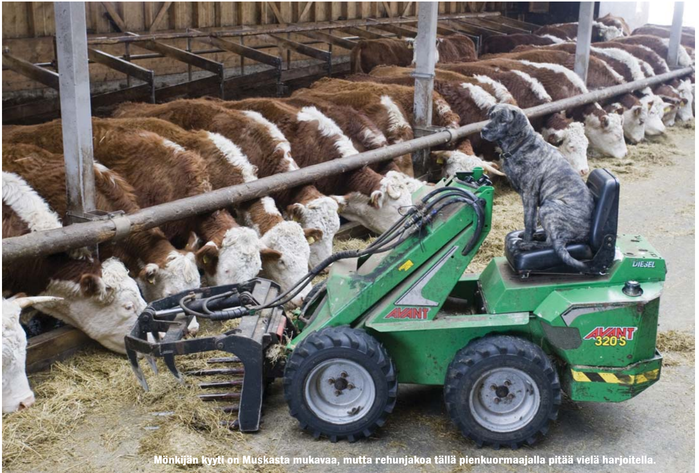
Mönkijän kyyti on Muskasta mukavaa, mutta rehunjakoa tällä pienkuormaajalla pitää vielä harjoitella.

Huuskojen Vattukorven tilalla on 56 emolehmää. Siitossonneja on kaksi ja nuorkarjaa parisenkymmentä. – Tämänkokoisella tilalla pärjää yhdellä koiralla, mutta varakoira pitää olla. Riskit ovat